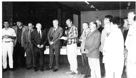
Cérémonie officielle le 28 août lors de l'arrivée du 1 er bus

Vous pouvez compter sur la Municipalité pour ne pas lâcher ce dossier.