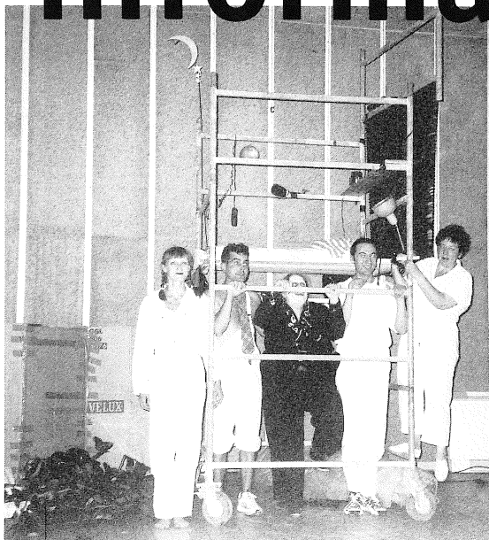
La troupe du "Théâtre des Guetteurs d'Ombres"