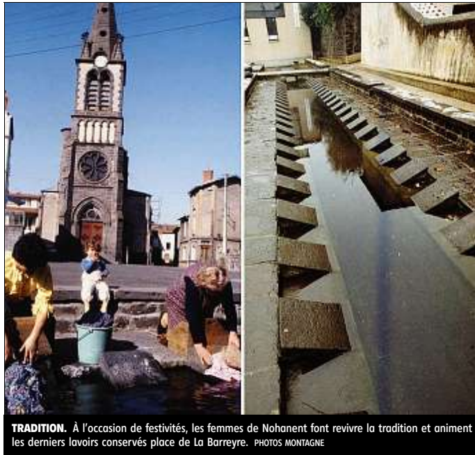
TRADITION. À l'occasion de festivités, les femmes de Nohanent font revivre la tradition et animent les derniers lavoirs conservés place de La Barreyre.

Cet artisanat se développant, s'organisa hebdomadairement et se hiérarchisa. Il battit son plein au XIX e , où l'on a compté plus de trois cents laveuses sur six bassins de quarante postes chacun (chiffres de 1872). Devant les fameuses « laves » (2), les femmes s'installaient à genoux dans des caisses en bois, pour le premier acte de « la bujade » : détrempe et savonnage du linge. Ve-