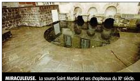
MIRACULEUSE. La source Saint Martial et ses chapiteaux du XI e siècle.

(2) « Lave » : dalle inclinée en lave de Volvic (une par laveuse), sur laquelle le linge est battu et frappé.