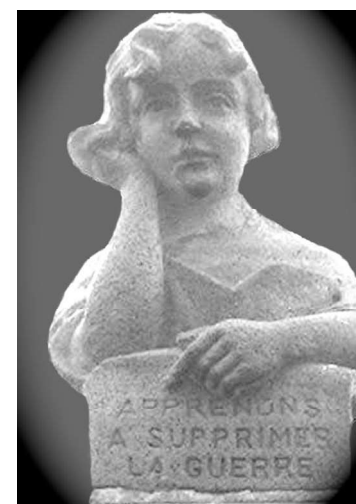
ROCLES (ALLIER) (2)