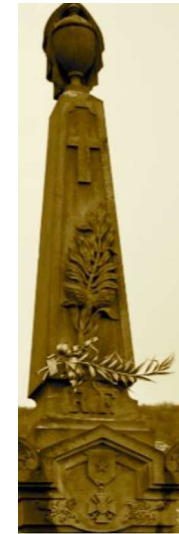
Celui de BILLOM